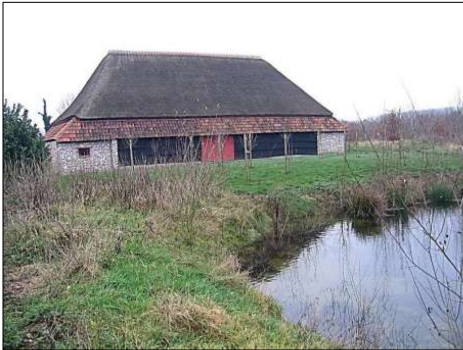
achterkant van de bergschuur

De stalling met 19 de eeuwse uitzicht heeft mogelijk 18 de eeuwse delen. De voorgevel heeft getoogde deuren en laaddeuren. Rechts is het wagenhuis. Binnenin is de zoldering voorzien van diltepersen tussen de moerbalken, eigen aan de streek. De bakstenen bevloering en slieten bleef behouden. Voor de stalling ligt een gedempte mestvaalt.