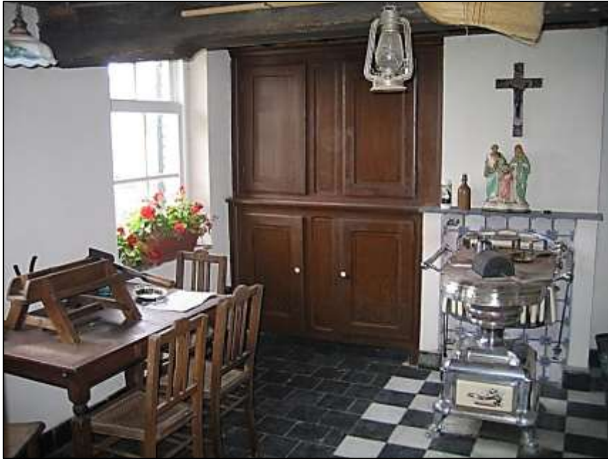
interieur van de leefruimte

De bergschuur is een vakwerkconstructie opgebouwd uit stijl- en regelwerk van olm en eik. In de binnenwanden van de schuur bleven talrijke sporen bewaard van het vlechtwerk met leembestrijking. Verschillende vakken werden opgevuld met baksteen. De oorspronkelijke gevels (zij- en voorgevels), waarvan de plankenbeschieting deels vervangen werd door baksteen, zijn ingesloten door de 19 de eeuwse bakstenen uitbreidingen. De achtergevel bleef wel vrij en wordt getypeerd door een horizontale plankenbeschieting op bakstenen voeting. De binnenzijde is bekleed met vitswerk. Het naar alle zijden afhellend dak was oorspronkelijk bedekt met stro, dat bewaard bleef tot circa 1940. Vandaag is het bekleed met golfplaten en Vlaamse pannen. De constructie heeft een ankerbalkspant waarop een schaargebinte rust. Dit type van spant is kenmerkend voor vakwerkconstructies. De schuur heeft één dorsvloer, twee tassen en vermoedelijk waren er 'karrenkoten' aan de zijkanten. De aardappelkelder werd later toegevoegd.