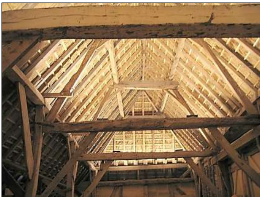
dakgebinte van de bergschuur

De bergschuur is een vakwerkconstructie opgebouwd uit stijl- en regelwerk van olm en eik. In de binnenwanden van de schuur bleven talrijke sporen bewaard van het vlechtwerk met leembestrijking. Verschillende vakken werden opgevuld met baksteen. De oorspronkelijke gevels (zij- en voorgevels), waarvan de plankenbeschieting deels vervangen werd door baksteen, zijn ingesloten door de 19 de eeuwse bakstenen uitbreidingen. De achtergevel bleef wel vrij en wordt getypeerd door een horizontale plankenbeschieting op bakstenen voeting. De binnenzijde is bekleed met vitswerk. Het naar alle zijden afhellend dak was oorspronkelijk bedekt met stro, dat bewaard bleef tot circa 1940. Vandaag is het bekleed met golfplaten en Vlaamse pannen. De constructie heeft een ankerbalkspant waarop een schaargebinte rust. Dit type van spant is kenmerkend voor vakwerkconstructies. De schuur heeft één dorsvloer, twee tassen en vermoedelijk waren er 'karrenkoten' aan de zijkanten. De aardappelkelder werd later toegevoegd.