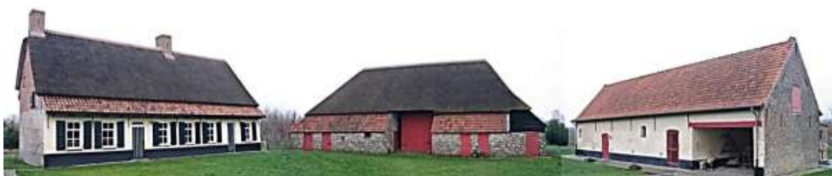
het erf, met links het woonhuis, in het midden de bergschuur en rechts de voormalige stalling

D e hofstede is gelegen ten noordwesten van de samenvloeiing van de Hooibeek, de Gaverbeek en de Potegembeek. De toegangsdreef is gelegen aan de Deerlijkseweg nr 35. Het boerenhuis, de bergschuur, stalling, wagenhuis en ovenbuur zijn sinds 2002 beschermd als monument.