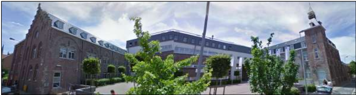
samengesteld panoramabeeld van de Kunstacademie vandaag (Google Street View)