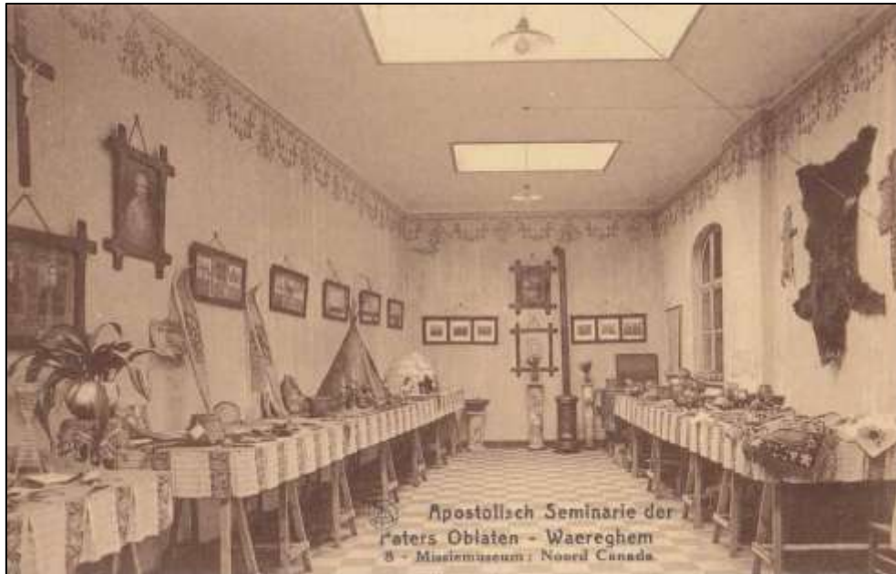
het missiemuseum van het "apostolisch seminarie der paters Oblaten"

De middenvleugel , gebouwd in 1954, werd in 2002 bijna helemaal vernieuwd. Hij is een stuk hoger dan de andere twee vleugels en heeft vlakke witgepleisterde gevels en een mansardedak bedekt met metalen platen. De oorspronkelijke zuilengalerij is bewaard gebleven maar zit verborgen achter een schuin volume afgewerkt met cederhout. Rechts is een brede doorgang van twee verdiepingen hoog, met links de ingang van de afdeling Muziek, Woord en Dans . Rechts in de doorgang is elk jaar een nieuw kunstwerk te zien gemaakt door de cursisten en lesgevers van de afdeling Beeldende Vorming . Dit schooljaar is dat een abstracte compositie van wildbreiwerk.