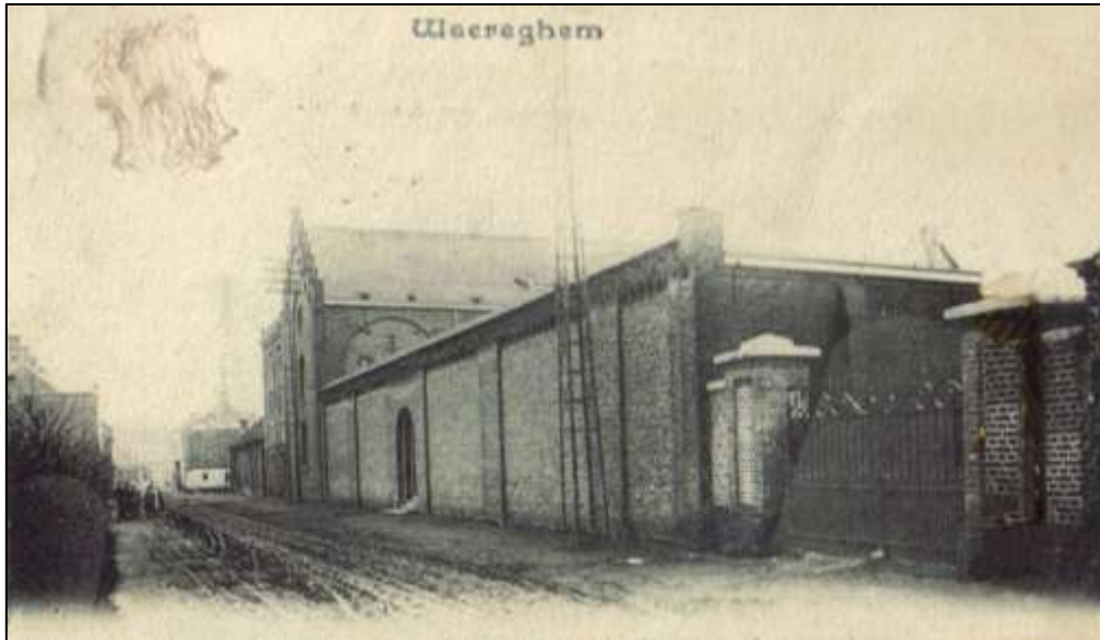
de Olmstraat vóór 1914, met het rechts Oblatenklooster, nog zonder de vleugel aan de straatkant