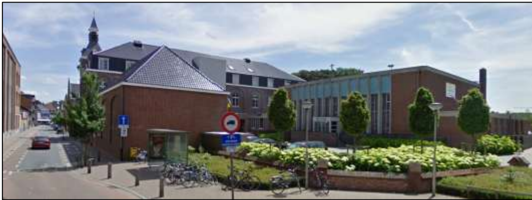
de Kunstacademie vanaf het kruispunt Olmstraat/Processiestraat met rechts de voormalige kapel

De voormalige kapel , gebouwd in 1964, is opgetrokken in oranje baksteenbouw onder een licht naar achter hellend lessenaarsdak. De kapel heeft een waaiervormige plattegrond. De voorgevel is quasi volledig opengewerkt met een glaswand in een betonnen skelet met verticale onderverdelingen. De toegang is vernieuwd. Het koor van de kapel is een afgerond en iets hoger volume. Rechts staat een lagere aanbouw met aluminiumramen. De kapel wordt nu gebruikt als concertzaal, en om de twee jaar voor de kunstveiling van de afdeling Beeldende Vorming .