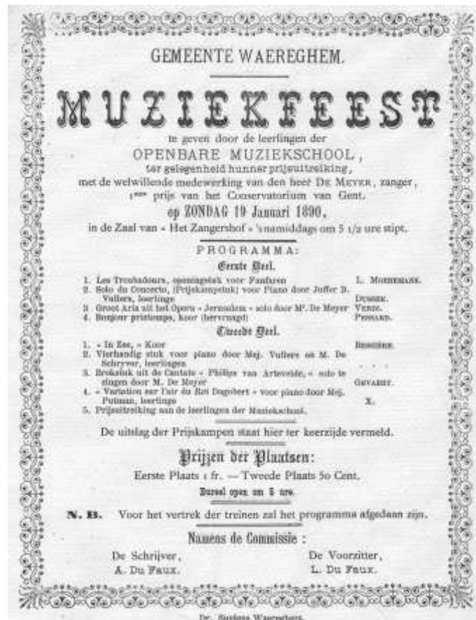
programma van het Muziekfeest van de Gemeentelijke Muziekschool in 1890