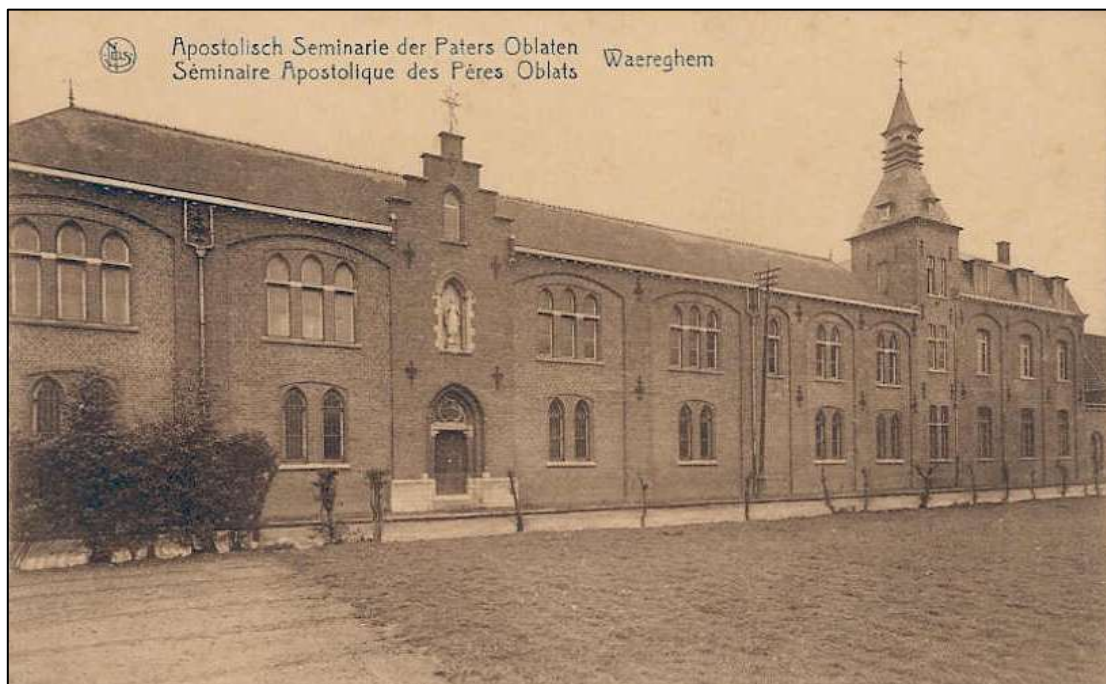
de gesloopte vleugel aan de straatkant van het "Apostolisch Seminarie der Paters Oblaten" Bemerk dat de overkant van de Olmstraat nog niet bebouwd was. Daar staat nu het H.-Hartcollege.