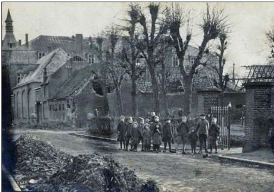
de Olmstraat vlak na de beschietingen van oktober-november 1918, met rechts vooraan de poort van het oude kerkhof en achteraan het zwaar beschadigde Klein Seminarie van de paters Oblaten

De afdeling Beeldende Vorming werkt samen met het platform voor actuele kunst Be Part van de provincie West-Vlaanderen, in de Westerlaan 17. Op het einde van het schooljaar organiseert ze telkens een opendeurdag en tentoonstelling met de beste werken van de leerlingen en cursisten. Regelmatig zijn er ook tentoonstellingen in Zaal 29 , meestal met werk van de eigen lesgevers of lesgevers van andere academies. De tentoonstellingen zijn vrij toegankelijk, van dinsdag tot zaterdag, van 9u tot 19u. De afdeling Muziek organiseert elk jaar eind oktober een concertweek, met concerten door de lesgevers in het grote auditorium.