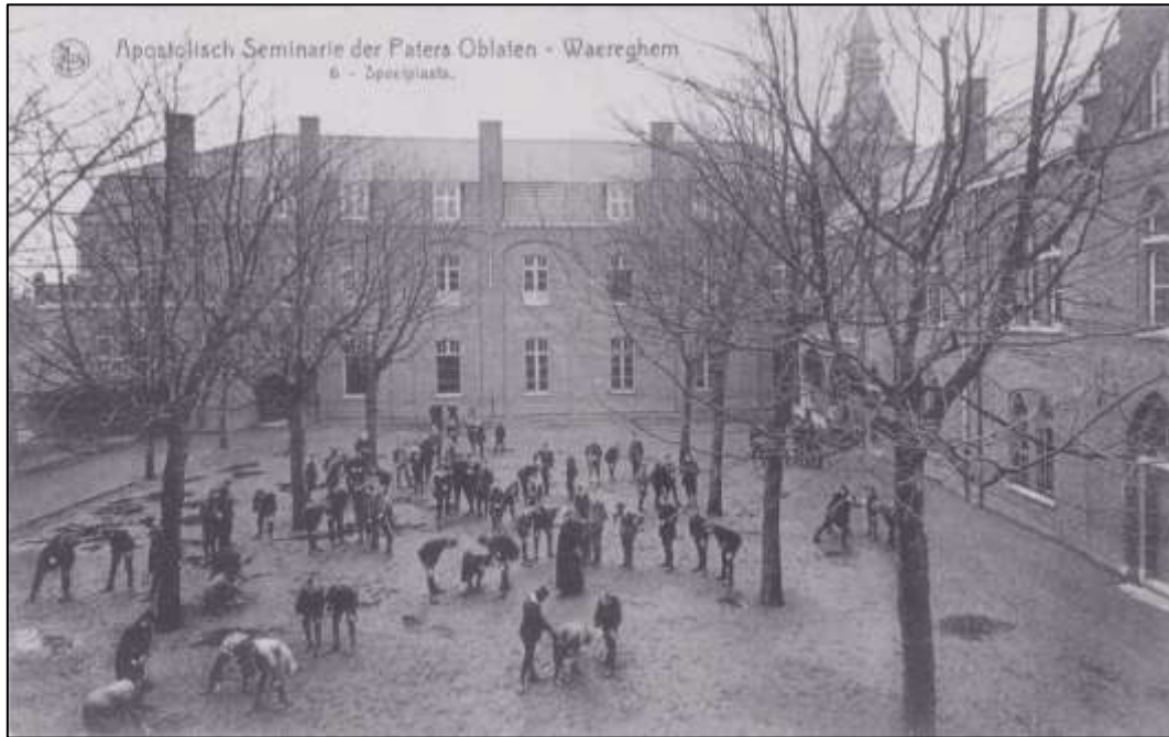
de vroegere speelplaats van de 'paters Oblaten' (rechts de kant van de Olmstraat)

De kunstcampus op de hoek van de Olmstraat en de Processiestraat bestaat vandaag uit drie vleugels van twee of drie bouwlagen, rond een open binnenplein, een lager volume langs de Olmstraat en de vroegere kapel aan de kant van de Processiestraat.