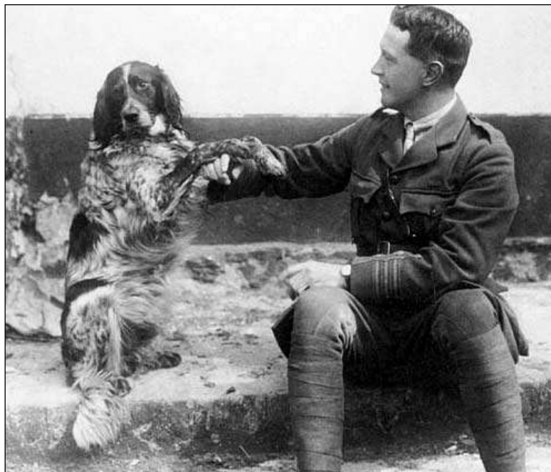
John McCrae en Bonneau