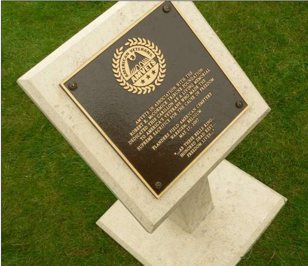
gedenkplaat ter gelegenheid van de plaatsing van de beiaard