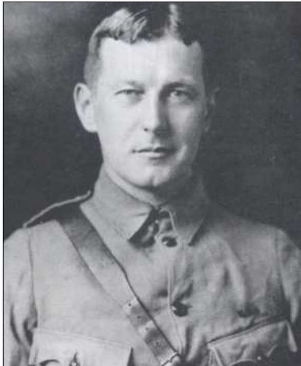
John McCrae (1872-1918)

Geen enkel gedicht maakte de naam van Vlaanderen zo bekend in de Engelssprekende wereld. Het gedicht, met een universele boodschap van offer en strijd voor de vrede, maakte de klaproos ook tot het symbool van alle oorlogsleed. De poppy was het enige bloempje dat welig groeide in het maanlandschap van de “Ypres Salient” (het boogvormige front rond Ieper). Omwille van het gedicht heeft deze plaats voor veel Amerikanen een bijzondere betekenis.