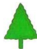
91 e Div.