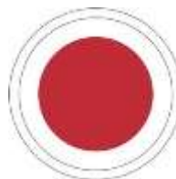
37 e Div.